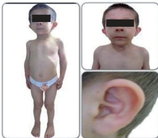
Fenotipo del paciente.

Discusión: En un paciente con infecciones respiratorias repetidas, esteatorrea y alteraciones fenotípicas del paciente, asociadas a estenosis pulmonar, CIA (comunicación interauricular), ectasia pielocalicial bilateral, criptorquidea, hipotiroidismo, se debe sospechar y a la vez descartar desordenes genéticos como el síndrome de duplicación del cromosoma 8 y fibrosis quística. El estudio genético evidenció; cariotipo masculino en desequilibrio con duplicación parcial del segmento distal del brazo largo de un cromosoma 8, sabiendo que esta mutación es nueva será necesario mayores estudios y seguimiento de investigación para llegar a la descripción de esta mutación.