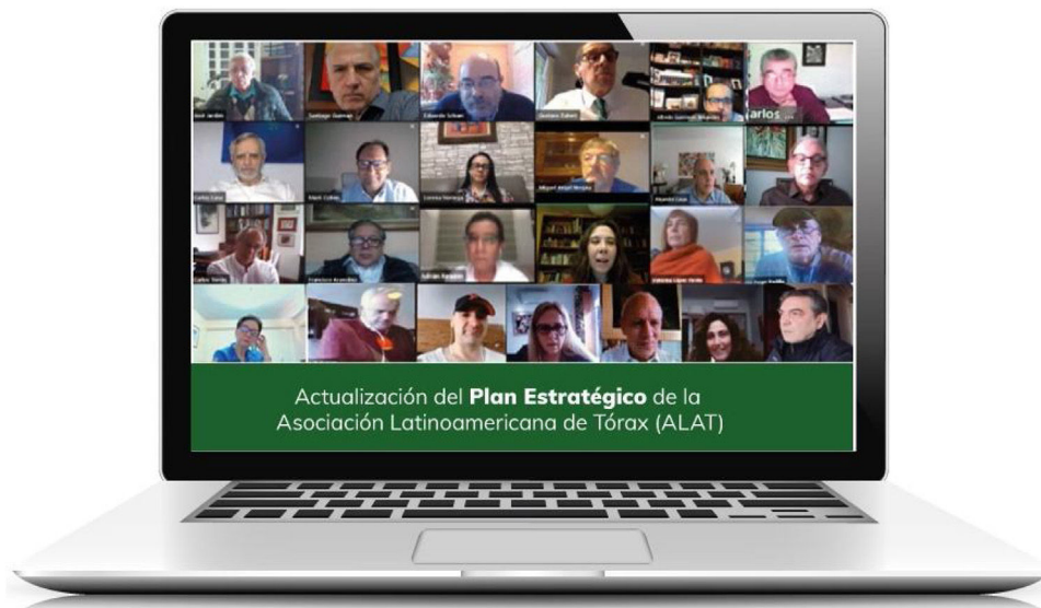
Figura 1. Participantes en el Plan Estratégico de ALAT 2021-2026.