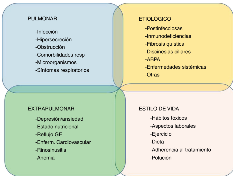
Figura 2. Propuesta de rasgos tratables en bronquiectasias. ABPA: aspergilosis broncopulmonar alérgica; GE: gastroesofágico.