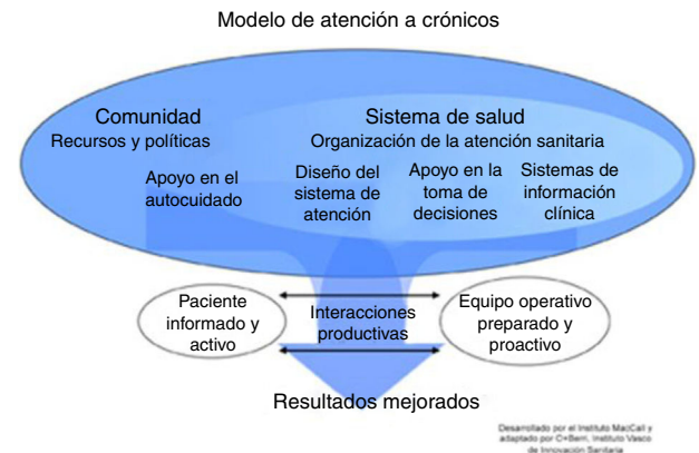
Figura 1. Modelo universal de gestión de enfermedades crónicas.

Los pacientes con necesidades complejas a menudo muestran una evolución dinámica, por lo que el tipo de seguimiento y