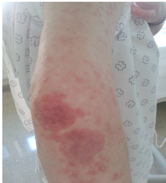
Figura 1. Psoriasis vulgar grave. Imagen del brazo y antebrazo de la paciente.

Mujer de 38 años diagnosticada de psoriasis vulgar grave (fig. 1) de 9 años de evolución, en tratamiento con corticoides tópicos, a la que se le realiza radiografía de tórax y Mantoux previos al inicio de tratamiento biológico sistémico, estando asintomática desde el punto de vista respiratorio, con hallazgo casual de adenopatías hiliares derechas (fig. 2A). Se completa el estudio con TC torácica (fig. 2B), que muestra adenopatías hiliares y mediastínicas de tamaño patológico e infiltrados parenquimatosos bilaterales en vidrio deslustrado. La ECA fue normal. Se realizó fibrobroncoscopia, siendo el cultivo de broncoaspirado (BAS) y lavado broncoalveolar (BAL) negativos, y la citología negativa para malignidad. El análisis inmunofenotípico del BAL mostró una población linfocitaria de predominio CD3+ (96%), con un cociente CD4/CD8 de 6.67. Se llevó a cabo una PAAF guiada por ecoendoscopia digestiva (EUS) siendo la muestra de escasa representatividad, resultando no