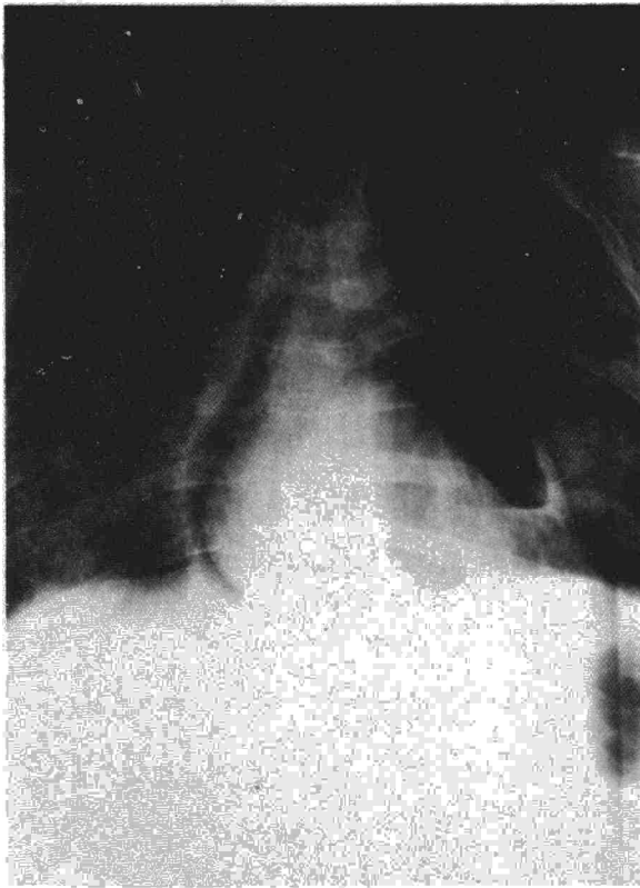
Fig. 1. Neumomediastino: se observa la existencia de aire extraparenquimatoso paralelo al borde de la silueta cardíaca.