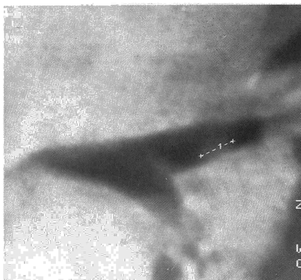
Fig. 1. TAC: Formación nodular de 6 mm en cara posterior del bronquio del lóbulo superior izquierdo de baja densidad.

Presentamos un caso de un fibrolipoma bronquial, que viene a representar el tercer caso de nuestro grupo 4 , el cual asentaba en un paciente de 49 años, fumador de 40 cigarrillos día desde los 15 años, que comienza un mes antes de su ingreso con parestesias en mano izquierda, acompañado de dolor en hemitórax izquierdo que le ha desaparecido espontáneamente y tos seca. En la exploración física destaca únicamente una abolición del murmullo vesicular en campo superior de hemitórax izquierdo, acompañado de roncus y sibilancias diseminados por ambos hemitó-