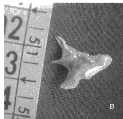
Fig. 1B. Aspecto macroscópico.

plazo como neumonías, abscesos pulmonares crónicos o bronquiectasias. La forma asfíctica aguda suele ser la más frecuente tanto en niños como en adultos; es posible, sin embargo, que el episodio aspirativo pase desapercibido y la sintomatología se presente tras un período de días o semanas.