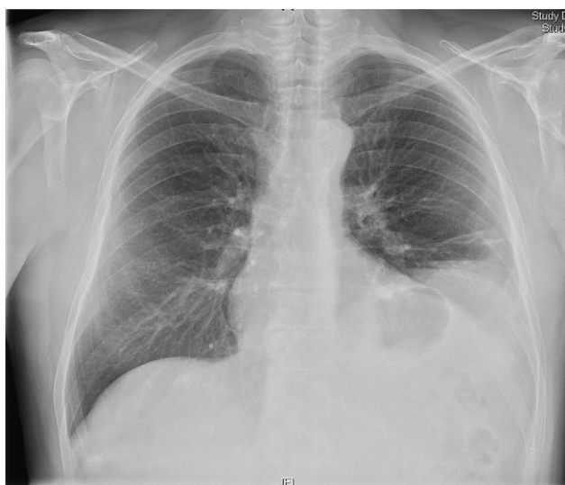
Figura 1. Radiografía de tórax posteroanterior. Se aprecia elevación del hemidiafragma izquierdo.