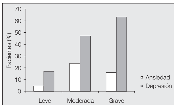
Fig.1. Prevalencia de ansiedad y depresión en población asmática, en situación estable y diferentes grados de gravedad (basado en datos de Martínez Pérez et al 7 ).

El trastorno de pánico es uno de los trastornos de ansiedad recogidos por la cuarta edición del Diagnostic and Statistical Manual of Mental Disorders (DSM-IV) 20 (tabla I). Su peculiaridad sustantiva es la aparición recurrente de crisis de pánico acompañadas de miedos y preocupación persistente acerca del ataque y sus consecuencias. Lo característico de tales ataques radica en la presencia de un estado agudo de ansiedad junto a síntomas físicos (disnea, palpitaciones, parestesias, temblor, opresión precordial, sudoración, náuseas, malestar abdominal) y cognitivos (miedo a morir, miedo a volverse loco, etc.) 19,21 . Dentro de este cuadro clínico, y como su-