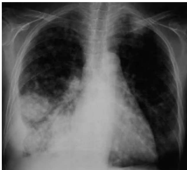
Fig. 1. Radiografía de tórax posteroanterior que muestra múltiples opacidades nodulares mal delimitadas, acinares, que afectan a ambos pulmones, con lesión nodular de mayor tamaño en el lóbulo inferior derecho asociada a la presencia de derrame pleural.

grafía torácica se apreciaban múltiples nódulos en ambos campos pulmonares y derrame pleural derecho, hallazgos que se confirman mediante tomografía computarizada de tórax (figs. 1 y 2).